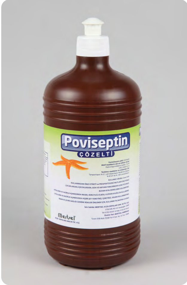
POVISEPTIN® ÇÖZELTİ 1000ml %10 Povidon İyot